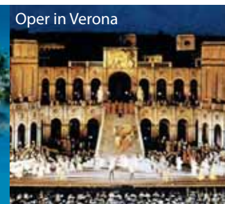
Oper in Verona

Wir sind Partnerbetrieb der THERME MERAN